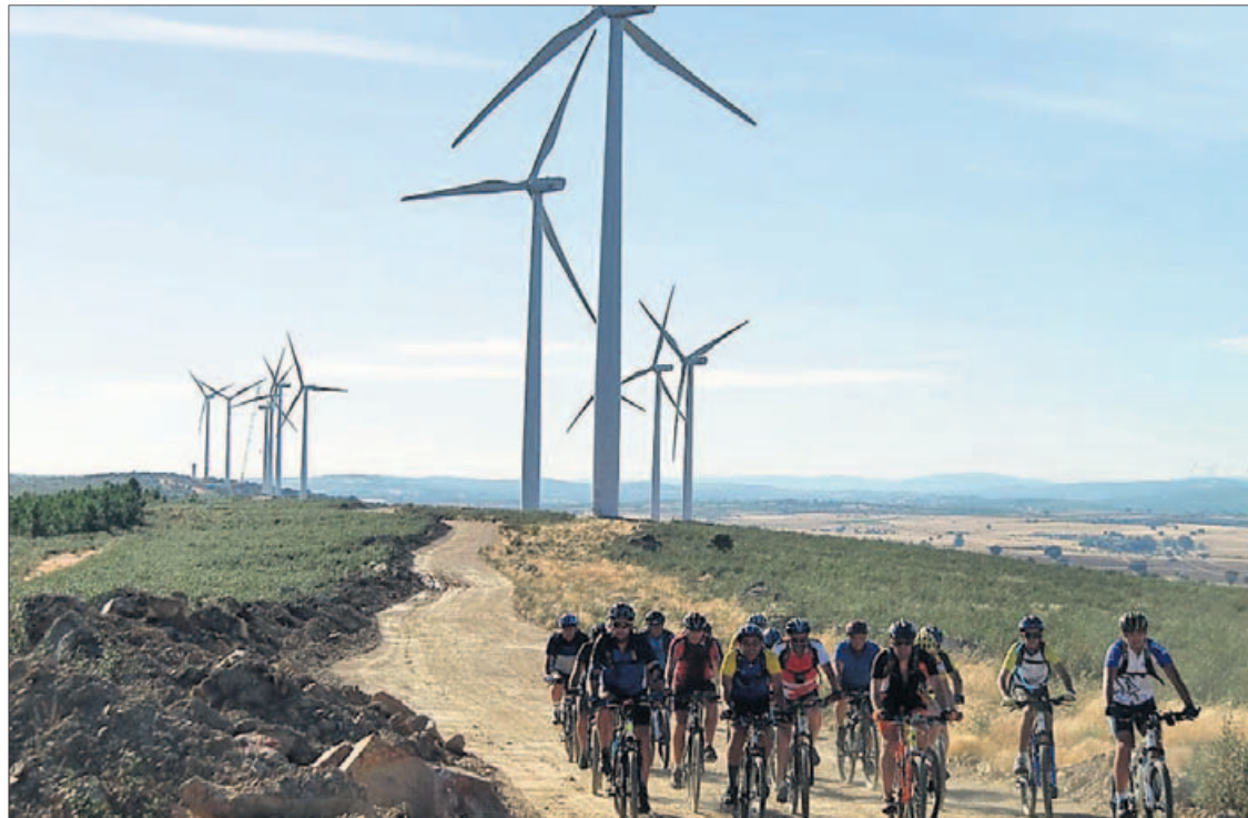
Ciclistas pasan junto a un parque eólico.

Tejerina sentenció que la «primera foto» tras las tres subastas energéticas con fines medioambientales no puede ser de satisfacción para el sector regional, con resultados llamativos por la adjudicación a determinados grupos empresariales sin intereses en la comunidad, como los de Aragón. Unos resultados que les hacen estimar que la comunidad, pese a estar a la cabe-