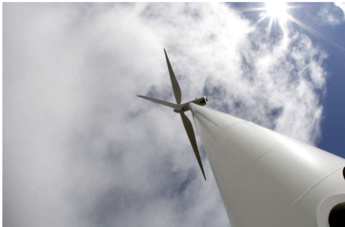
Aerogenerador en la provincia de Zamora.

Así, García Tejerina puso sobre la mesa esta circunstancia para una autonomía con infraestructuras de evacuación planificadas y en ejecución y con múltiples proyectos en los estadios finales de la tramitación administrativa, que dura años. Al respecto, remarcó que muchos proyectos previstos en otros